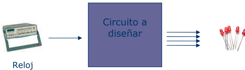
Figura 2. Entrada y salidas del sistema